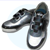
レンタルシューズ