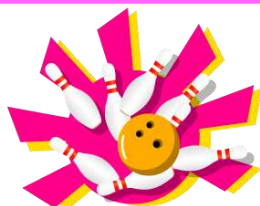
ボウリング2ゲーム