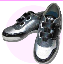
レンタルシューズ