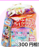
お菓子の袋詰め 300円相当