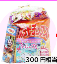
お菓子の袋詰め 300円相当