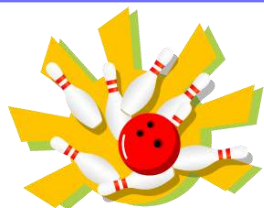
ボウリング2ゲーム