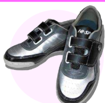
レンタルシューズ