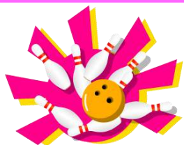
ボウリング2ゲーム