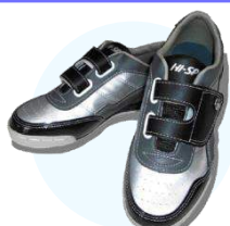
レンタルシューズ