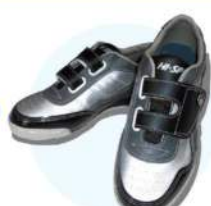
レンタルシューズ