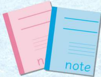
※イラストはイメージです