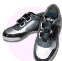
レンタルシューズ