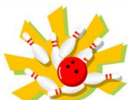
ボウリング2ゲーム