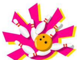
ボウリング2ゲーム